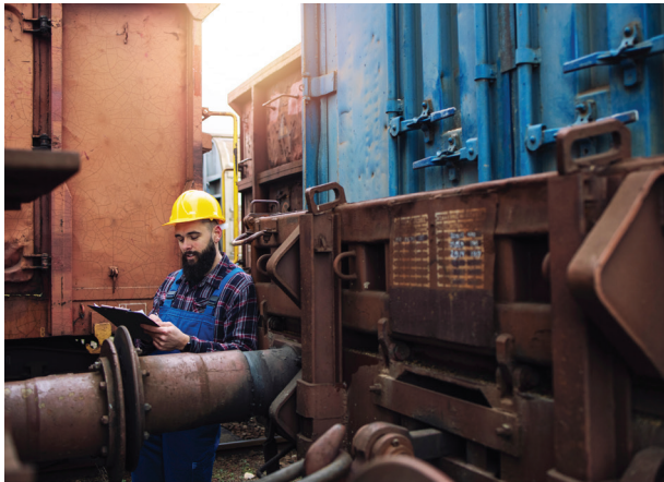
GRÁFICO DE ANÁLISE DE FALHAS

O projeto de mapeamento técnico personalizado é feito inicialmente por meio do estudo da frota do cliente. Todos os equipamentos são estudados para entender a operação e analisar a aplicação de nossos produtos. Com esses dados em mãos, é, então, realizada uma série de visitas técnicas ao cliente para dar início ao mapeamento e, dessa forma, elaborar o book hidráulico de mangueiras e terminais.